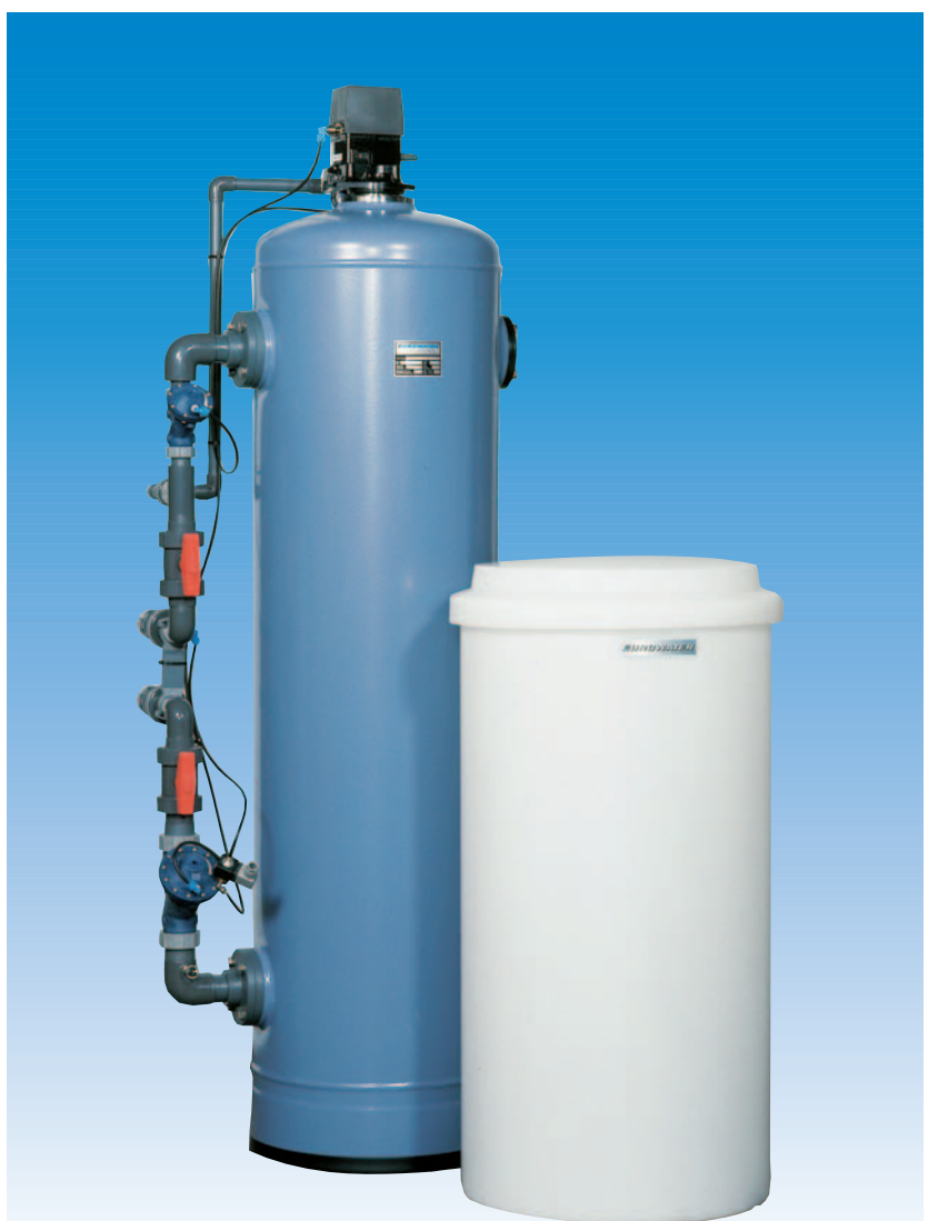
Typ SMH 601