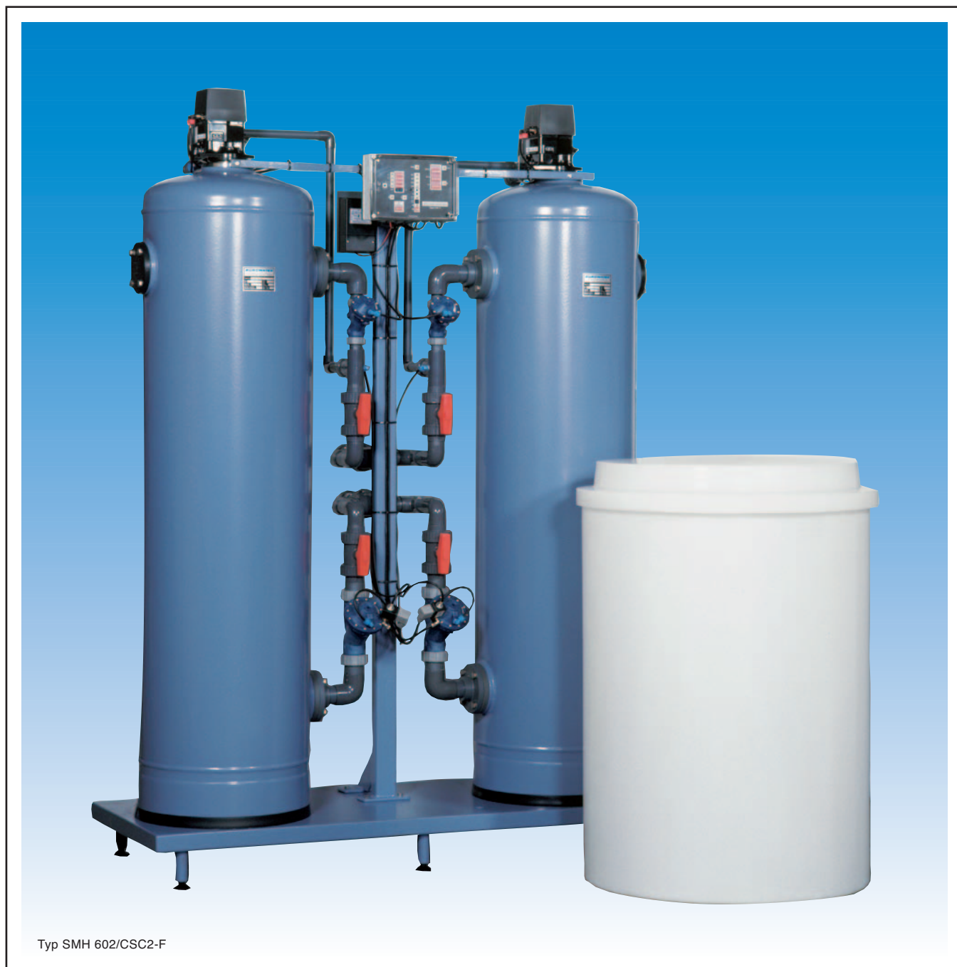
Typ SMH 602/CSC2-F